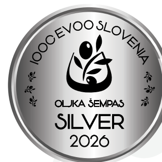
IOOC Oljka Šempas EVOO Slovenia SILVER 2026