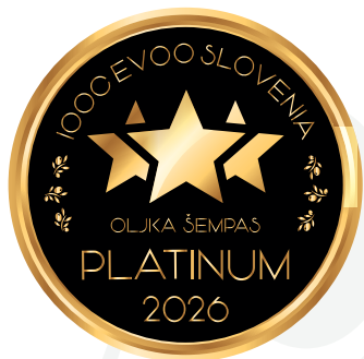
IOOC Oljka Šempas EVOO Slovenia PLATINUM 2026

Frantoio Cioccolini S.r.l. Via della Marescotta 7, 01039 Vignanello (VT) info@cioccolini.com - www.cioccolini.com