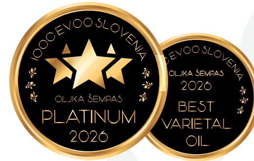
IOOC Oljka Šempas EVOO Slovenia PLATINUM 2026 IOOC Oljka Šempas EVOO Slovenia BEST VARIETAL OIL 2026