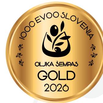
IOOC Oljka Šempas EVOO Slovenia GOLD 2026

Tonceva kmetija Ozeljan Ozeljan 91, 5261 Šempas (GO) martin.cotar@gmail.com