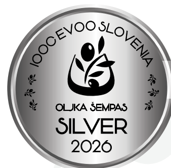
IOOC Oljka Šempas EVOO Slovenia SILVER 2026

Zagora 6, 5210 Deskle (GO) binstdoo@gmail.com - www.sanmartin.si