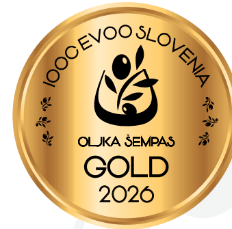
IOOC Oljka Šempas EVOO Slovenia GOLD 2026