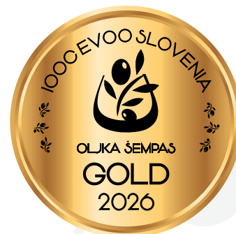
IOOC Oljka Šempas EVOO Slovenia GOLD 2026