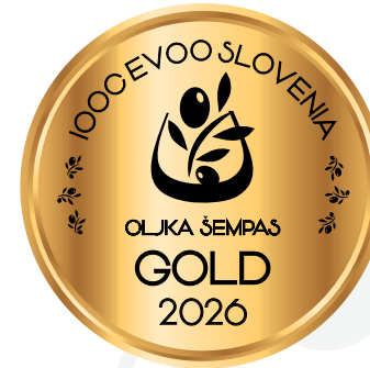
IOOC Oljka Šempas EVOO Slovenia GOLD 2026

Branko Trampuž Kostanjevica na Krasu 85a, 5296 Kostanjevica (GO) trampuz85@gmail.com