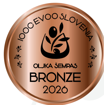
IOOC Oljka Šempas EVOO Slovenia BRONZE 2026

Kmetija Markežič Markova ul. 65, Bertoki, 6000 Koper (KP) jsmarnica@gmail.com