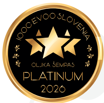
IOOC Oljka Šempas EVOO Slovenia PLATINUM 2026

Kmetija Sašo Čehovin Marezige 14, 6273 Marezige (KP) info@oliveoilredfairytale.si - www. oliveoilredfairytale.si