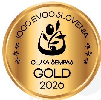
IOOC Oljka Šempas EVOO Slovenia GOLD 2026