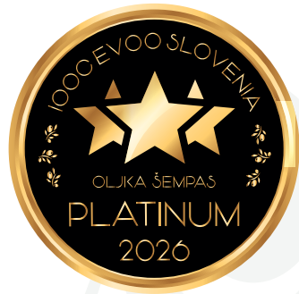
IOOC Oljka Šempas EVOO Slovenia PLATINUM 2026

Lisjak d.o.o. Šalara 28 b, 6000 Koper (KP) luka@lisjak.com - www.lisjak.com