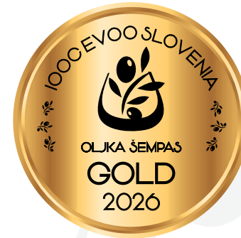
IOOC Oljka Šempas EVOO Slovenia GOLD 2026

Orehovlje 30 a, 5291 Miren (GO) radovan.silic@siol.net