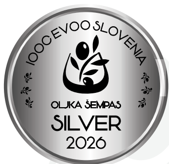
IOOC Oljka Šempas EVOO Slovenia SILVER 2026