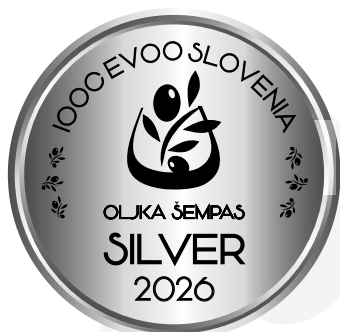
IOOC Oljka Šempas EVOO Slovenia SILVER 2026

Via Osoppo 65, 33030 Muris di Ragogna (UD) daniele.toniutti@libero.it