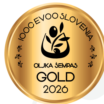
IOOC Oljka Šempas EVOO Slovenia GOLD 2026

Matjaž Zelič Cesta Jaka Platiše 7, 4000 Kranj (KR) matjaz.zelic@gmail.com