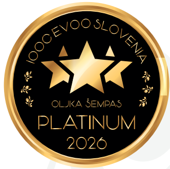
IOOC Oljka Šempas EVOO Slovenia PLATINUM 2026