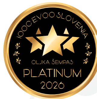
IOOC Oljka Šempas EVOO Slovenia PLATINUM 2026