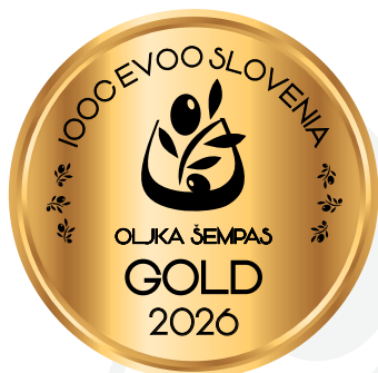
IOOC Oljka Šempas EVOO Slovenia GOLD 2026