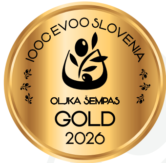
IOOC Oljka Šempas EVOO Slovenia GOLD 2026

Lisjak d.o.o. Šalara 28 b, 6000 Koper (KP) luka@lisjak.com - www.lisjak.com