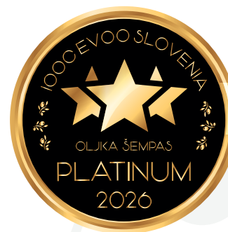
IOOC Oljka Šempas EVOO Slovenia PLATINUM 2026

Redžo Suloski Partizanska ulica 60, 5000 Nova Gorica (GO) redzo.suloski@gmail.com