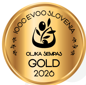
IOOC Oljka Šempas EVOO Slovenia GOLD 2026