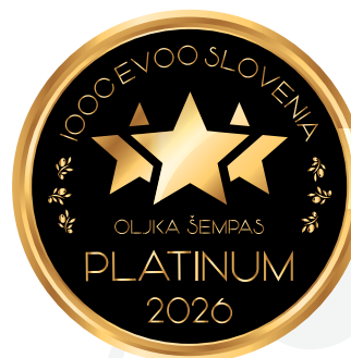
IOOC Oljka Šempas EVOO Slovenia PLATINUM 2026

Kmetija - Oljkarstvo Benjamin in Sara Ličer Sečovlje 100, 6333 Sečovlje (KP) benjaminlicer@gmail.com