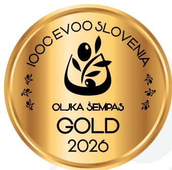
IOOC Oljka Šempas EVOO Slovenia GOLD 2026