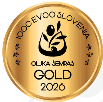
IOOC Oljka Šempas EVOO Slovenia GOLD 2026