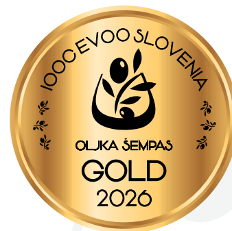
IOOC Oljka Šempas EVOO Slovenia GOLD 2026