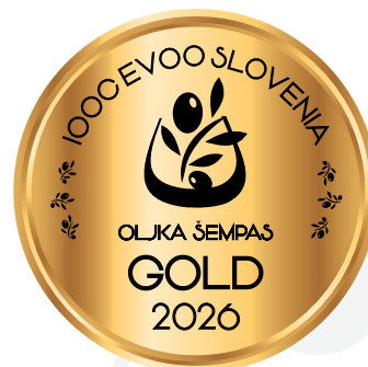
IOOC Oljka Šempas EVOO Slovenia GOLD 2026

orjana.hrvatin@guest.arnes.si - www.oljčno-olje.si