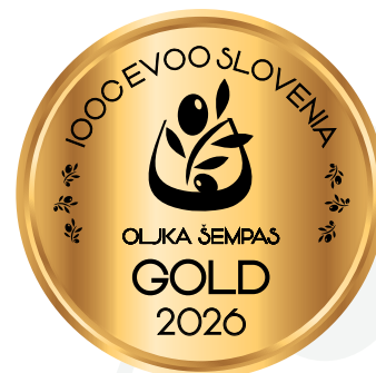
IOOC Oljka Šempas EVOO Slovenia GOLD 2026