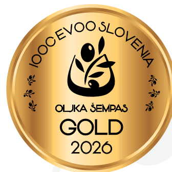
IOOC Oljka Šempas EVOO Slovenia GOLD 2026