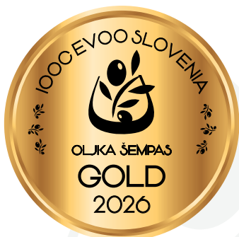
IOOC Oljka Šempas EVOO Slovenia GOLD 2026