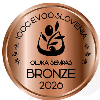
IOOC Oljka Šempas EVOO Slovenia BRONZE 2026