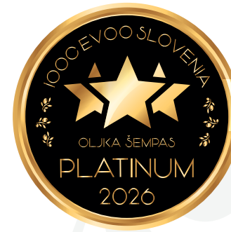
IOOC Oljka Šempas EVOO Slovenia PLATINUM 2026

Tenuta Severini Via Giovanni XXIII, 9, 87010 Mottafollone (CS) elodiaseverini@libero.it - www.tenutaseverini.it