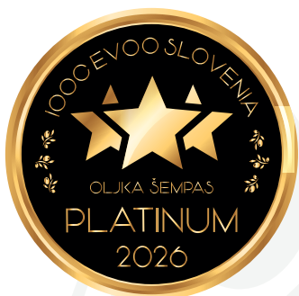
IOOC Oljka Šempas EVOO Slovenia PLATINUM 2026

Marsicani Nicolangelo Contrada Croceviale, 84030 Morigerati (SA) frantoio@marsicani.com - www.marsicani.com