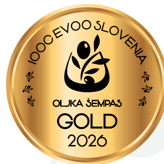
IOOC Oljka Šempas EVOO Slovenia GOLD 2026