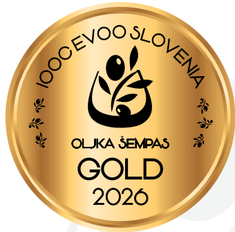
IOOC Oljka Šempas EVOO Slovenia GOLD 2026