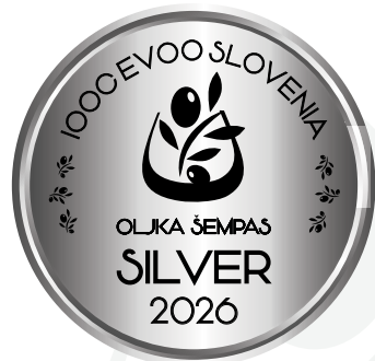
IOOC Oljka Šempas EVOO Slovenia SILVER 2026

Azienda Agricola Fachin Fernanda Via Pomponio Amalteo 5, 33013 Gemona del Friuli (UD) agricolafachin@gmail.com