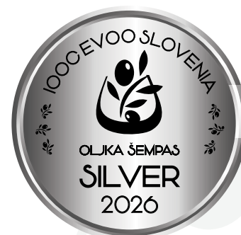
IOOC Oljka Šempas EVOO Slovenia SILVER 2026