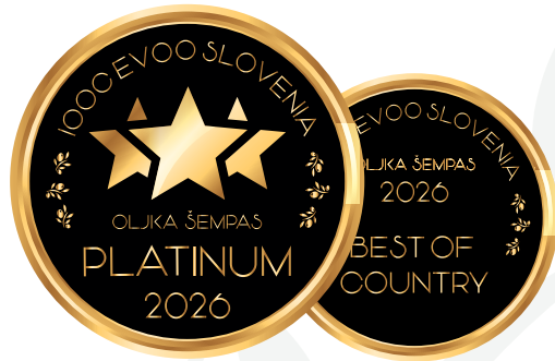
IOOC Oljka Šempas EVOO Slovenia PLATINUM 2026 IOOC Oljka Šempas EVOO Slovenia BEST OF COUNTRY 2026

Marsicani Nicolangelo Contrada Croceviale, 84030 Morigerati (SA) frantoio@marsicani.com - www.marsicani.com