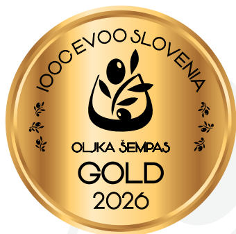
IOOC Oljka Šempas EVOO Slovenia GOLD 2026

Kmetija Pr'Rojca Babiči 48, 6273 Marezige (KP) oliveoilrojci@gmail.com